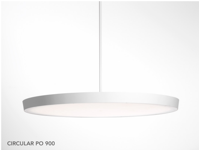
CIRCULAR PO 900