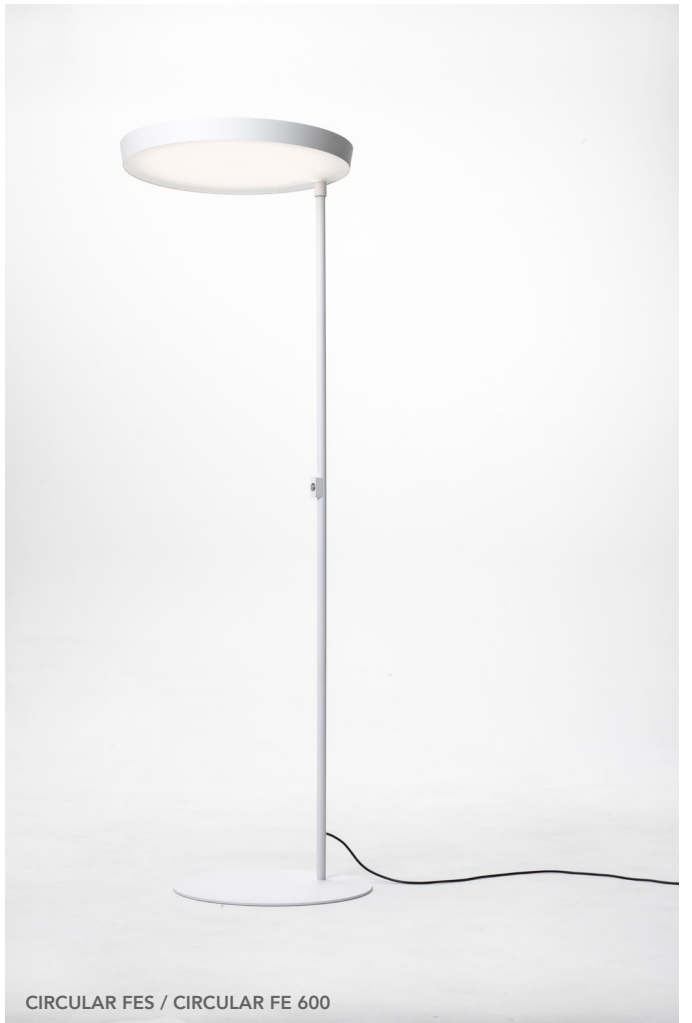
CIRCULAR FES / CIRCULAR FE 600